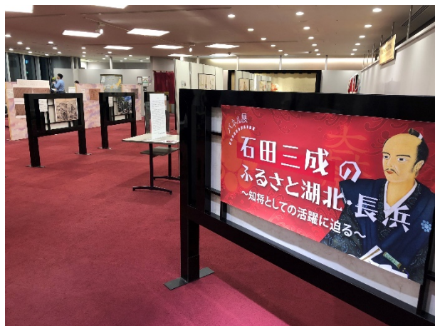
パネル展「石田三成のふるさと湖北・長浜〜知将としての活躍に迫る〜」歌舞伎座3階にて