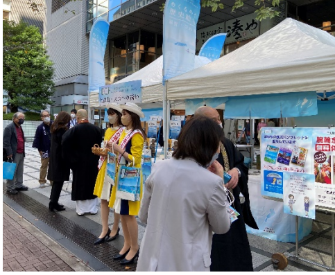
「めくるめく歴史絵巻 滋賀・びわ湖」の様子

また、比叡山延暦寺のお寺さんの直接指導による腕輪念珠ワークショップは、比叡山から伐採された桜による木珠や、生まれ年の梵字をあしらった自分だけの木珠づくりが楽しめるということもあり、毎回すぐに定員となる盛況でした。最後に御祈祷もしていただき、山ファンになっていただけたこと間違いなしです。