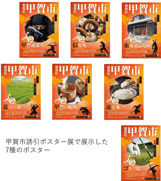
甲賀市誘引ポスター展で展示した7種のポスター

人の交流を避けつつアピールできるポスター展の有効性を活かし、文化に造詣が深い歌舞伎座のお客様に、アフターコロナの旅行先の候補地として、甲賀市を印象付けられたことと思います。