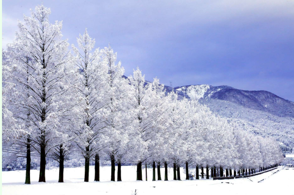
上写真：雪のマキノメタセコイア並木 表紙写真：浮御堂