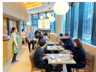
↑和菓子作り体験の様子

「ここ滋賀」は平成二十九年十月二十九日の開設から今年で五周年を迎えました。これまで御愛顧いただいたお客様に感謝の気持ちを伝えるとともに、更なる滋賀の魅力発信するため、開設記念日である十月二十九日(土)から十一月六日(日)の九日間、「ここ滋賀五周年感謝祭」を開催しました。五周年記念HAPPY BAGをはじめ、近江牛、地酒や限定パンの販売のほか、五周年記念トークショー「戦国のまち、近江・滋賀の名将たち」の開催、信楽焼や和菓子作りの体験会など、様々なイベントで皆様をお迎えしました。