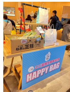
←HAPPY BAGはすぐに完売するほど大好評でした