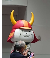
↑彦根城のアーピールにひこにゃんも登場