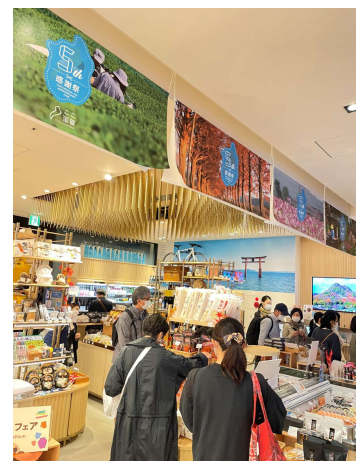
↑大盛況の「ここ滋賀」5周年感謝祭