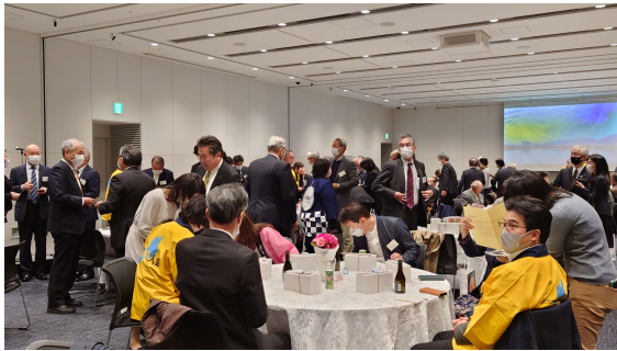
↑昼食会後の懇談の様子

日曜日の日中という例年とは違う形での開催にはなりましたが、約百五十名の方々にご参加いただき、三年ぶりに交流を温めていただく機会になりました。