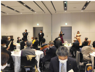
↑びわ湖ホール声楽アンサンブルコンサート